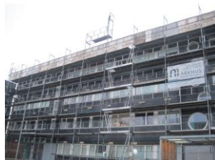
Udbedring af skaderne er i gang.