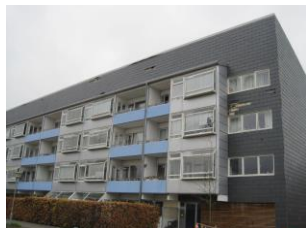
Facadeplader er blæst af.