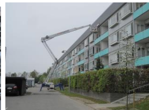
Nedfaldne facadeskiffer er udskiftet.