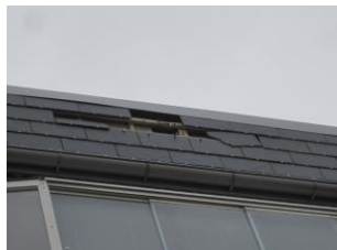
Facadeplader blæst af