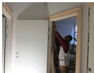
Genopbygning i gang.