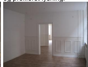
Stuen efter genopbygning.