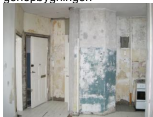
Nedrivning så småt i gang.