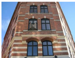
Den smukke ejendom