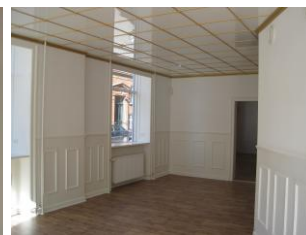
Færdigt resultat, glasloft og profileret lysning.