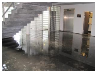
Blankt vand på gulve