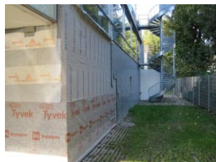
- såvel som udvendigt.