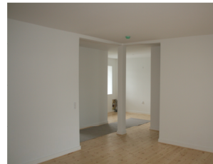
Lejlighed efter udbedring af brandskade