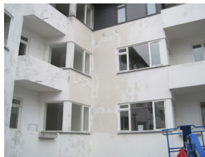
Facaden afrenset for smeltet tagpap m.v.