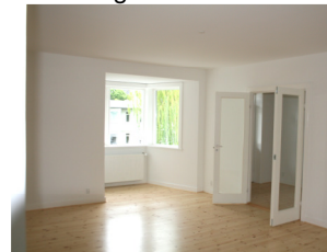
Lejlighed efter udbedring af brandskade