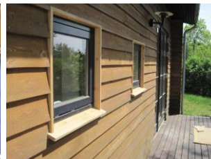
Ny bræddebeklædning udvendigt.