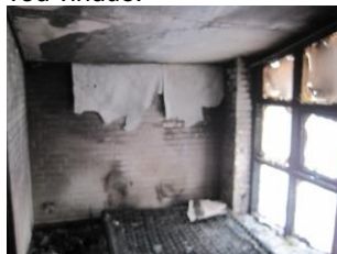
Soveværelse, meget medtaget af branden.