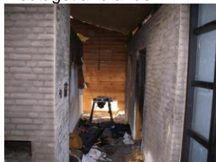
Entre, ligeledes meget medtaget.