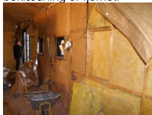
Indvendig beklædning fjernet.