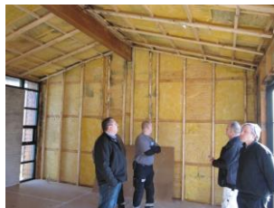
Stue, hvor indvendig beklædning er fjernet.