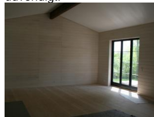
Nyrenoveret stue med nyt gulv.