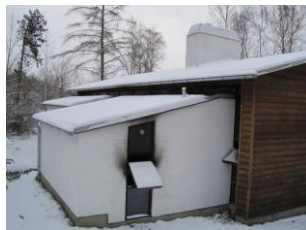
Tilbygning, hvor sod ses ved vindue.