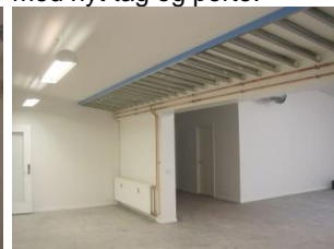
Indvendigt er lokalerne opgraderet til moderne forhold.