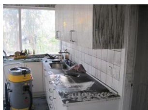
Indvendige røg- og sodskader