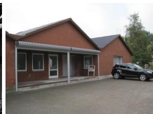
Ejendommen fra gavlen, med nyt tag og porte.