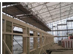
Genopbygningen foregik under totaloverdækning.