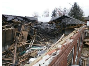
Den totalt udbrændte tagkonstruktion