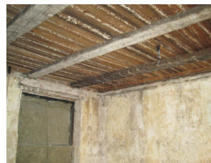
Lofter og vægge er rensede ned