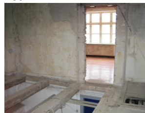
Etagebjælker mod kælder er blotlagt