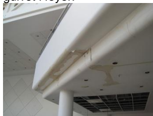
Afskalning som følge af vand.