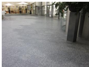
Store fugtskjolder på gulvet i foyer.