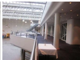
Den renoverede balkon.