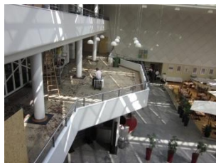
Balkongulv brudt op.