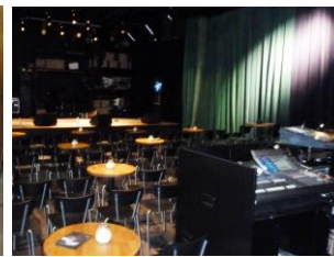
Et kig op mod scenen.