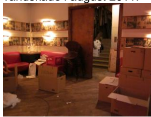
Indbo pakkes i flyttekasser.