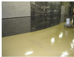
Det nye gulv bliver lagt.