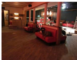
Jazzhouse blev ramt af vandskade i august 2011.