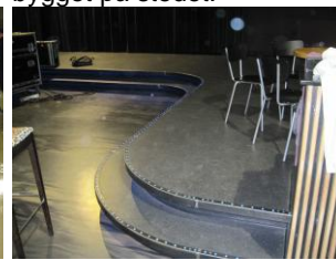
Podier med indlagt lys.