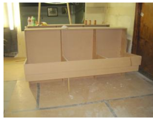
Publikumssofaer opbygges på stedet.