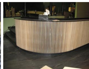
Den nye runde bar er bygget på stedet.