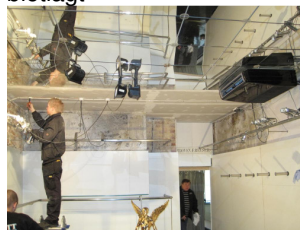
Demontering af belysning