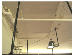
Udbedring af loft