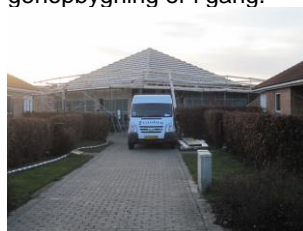
Genopført og lukket mod vejrlig.