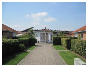
Det udbrændte fælleshus.