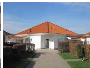
Fælleshuset, genopført som eksisterende.