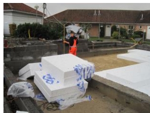
Fælleshuset er revet ned, genopbygning er i gang.