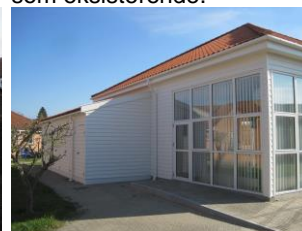
Det afsluttede projekt.