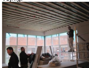
Indvendige arbejder pågår.