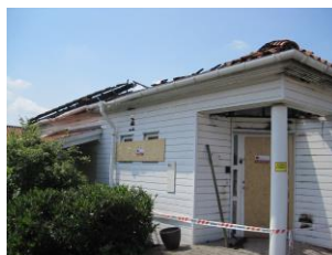
Ukrudtsafbrænding var årsag til branden.