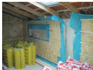
Isolering af ydervægge