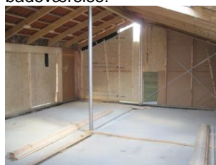
Klar til genopbygning.