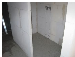
Opbygning af badeværelse.