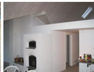
Køkken og masseovn.