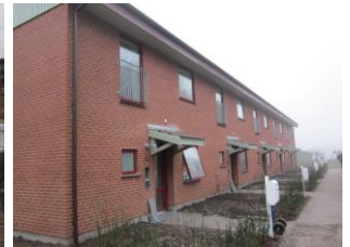
Reetablering med beplantning og fliser afsluttet