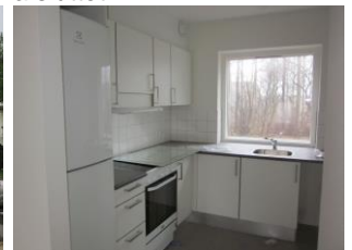
Det nye køkken.