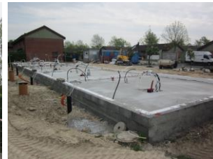
I foråret 2013 begyndte genopbygningen.