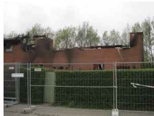
De stærkt medtagne rækkehuse.