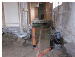
Alle gulve brudt op og ny kloak etableres.