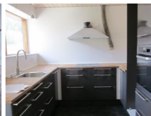
Køkken efter genopbygning