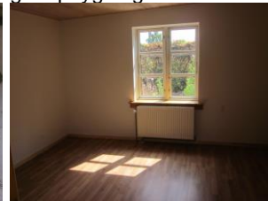
Det færdige resultat, værelse.