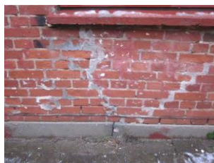
Kraftige sætningsskader som følge af utæt kloak.