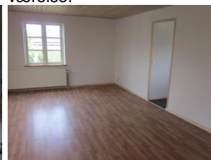
Det færdige resultat, stue.