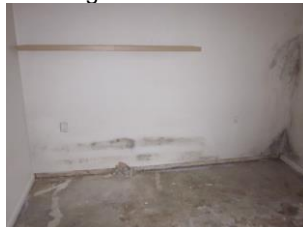
Fugt i værelse.