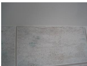
Revne og porøse fuger.