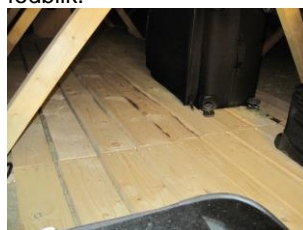
Gangbrosplanker er samlet over samme spær.