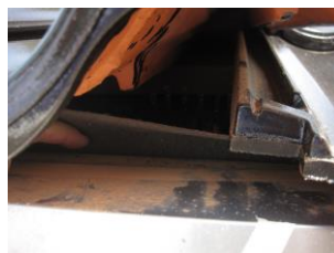
Undertag er ikke klæbet til fodblik.