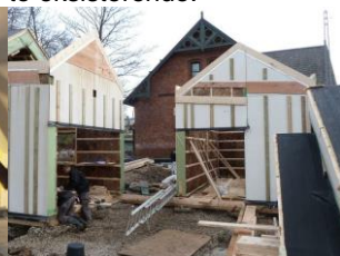
Mellembygningen under opførelse.