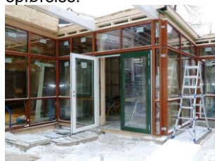
Mellembygningen under opførelse.