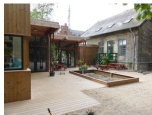
Den ny mellembygning set legepladsen.