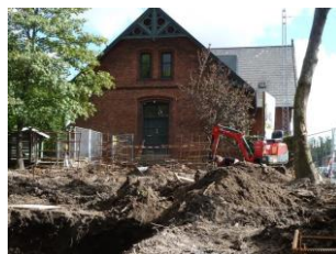
Her opføres en mellembygning, der forbinder de to eksisterende.